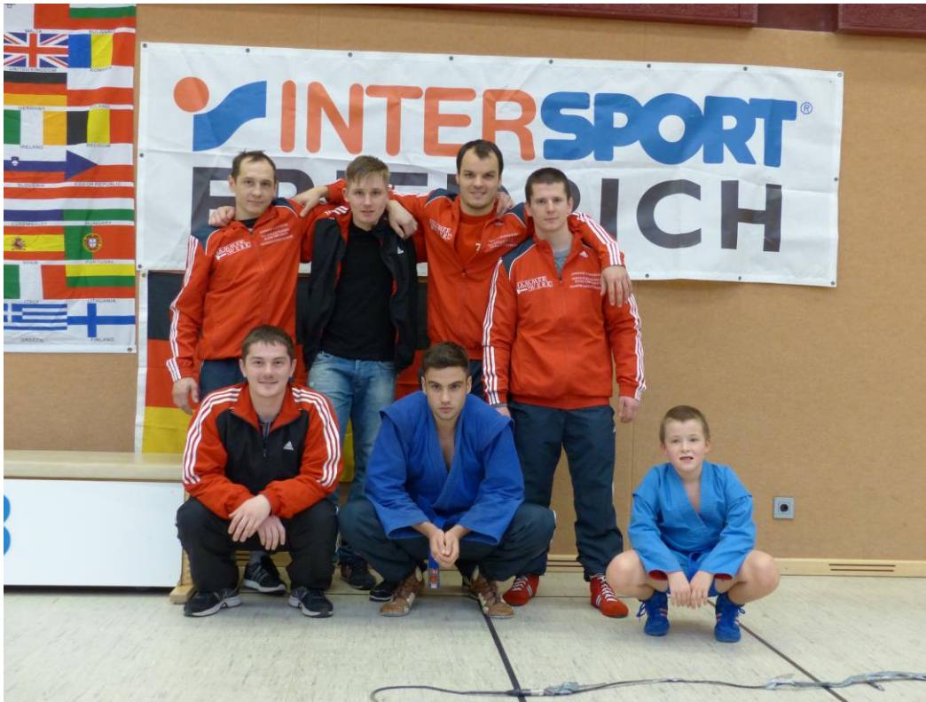
Offene Landesmeisterschaft 2015 in Lüneburg