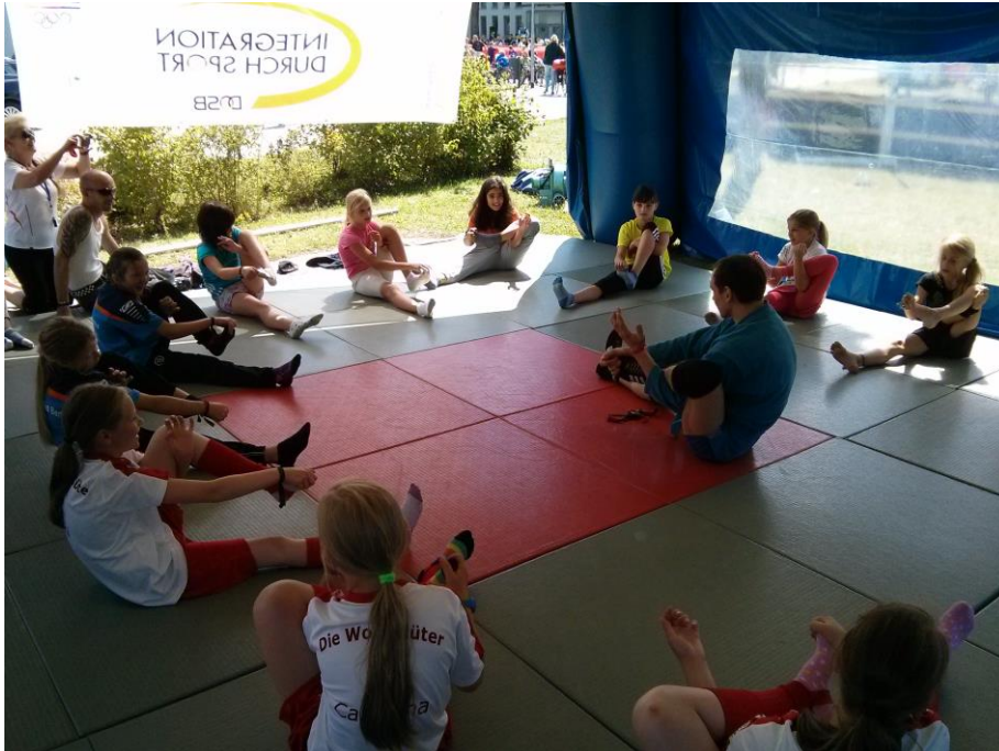
Samboworkshop auf Rügen